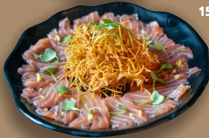
152 - USSUZUKURI DE SALMÃO, ATUM OU POLVO ... 79,90

Vieiras seladas, atum selado com molho de ostra cítrico, finalizado com molho trufado de pimentão e tsukemono.