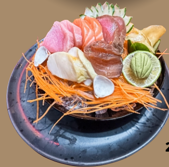
200 - MATSURI SASHIMI MIX (25 CORTES) ..... 159,90

Carpaccio com azeite de trufa e ovas negras.