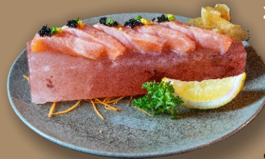
201 - SALMÃO OU ATUM NA PEDRA DE SAL (5 UN.) 49,90

Barriga de salmão ou atum fresco, levemente maçaricado, com molho cítrico, flor de sal, limão Siciliano e ovas de peixe.