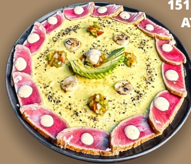
151 - VIEIRAS SELADAS E ATUM TATAKI ..... 159,90

2 Niguiris de Atum trufado, 2 Niguiris de Salmão Zuke, 2 de Salmão Tsukemono, 2 de Robalo e Ovas, 2 Camarão na Mostarda 2 Niguiris de Atum Zuke e 2 Polvo com molho Negro.