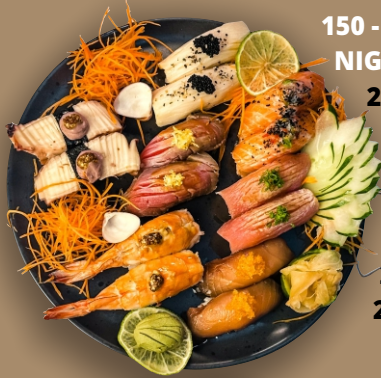
150 - COMBINADO DE NIGURIS ESPECIAIS ..... 159,90

Bolinhos de arroz temperado, cobertos ou envoltos com corte especial de peixe ou frutos do mar, e sashimis (cortes em porções).